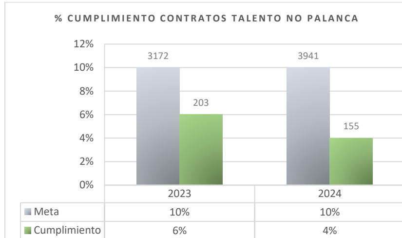
Gráfica No. 1: Ejecución estrategia Talento No Palanca

Nota: Ejecución 2024: corte a 30 de agosto.